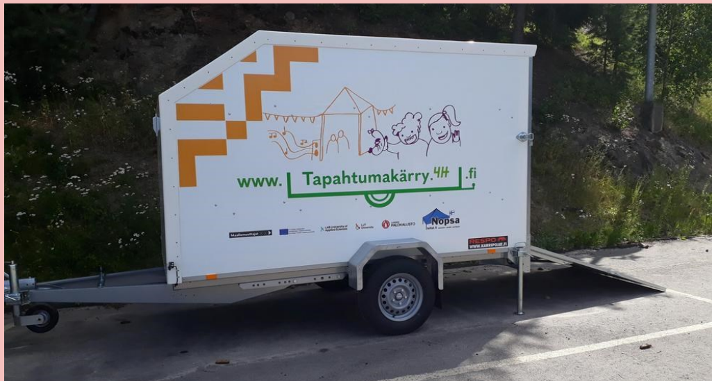
Tapahtumakärri 4H Maallemuuttajat 2030 -hanke

Hankasalmen kunta hankkii "liikuteltavan esiintymislavan", jonka hintalappu on 15 000 euroa – "Olisi hyvä tai jopa välttämätön"