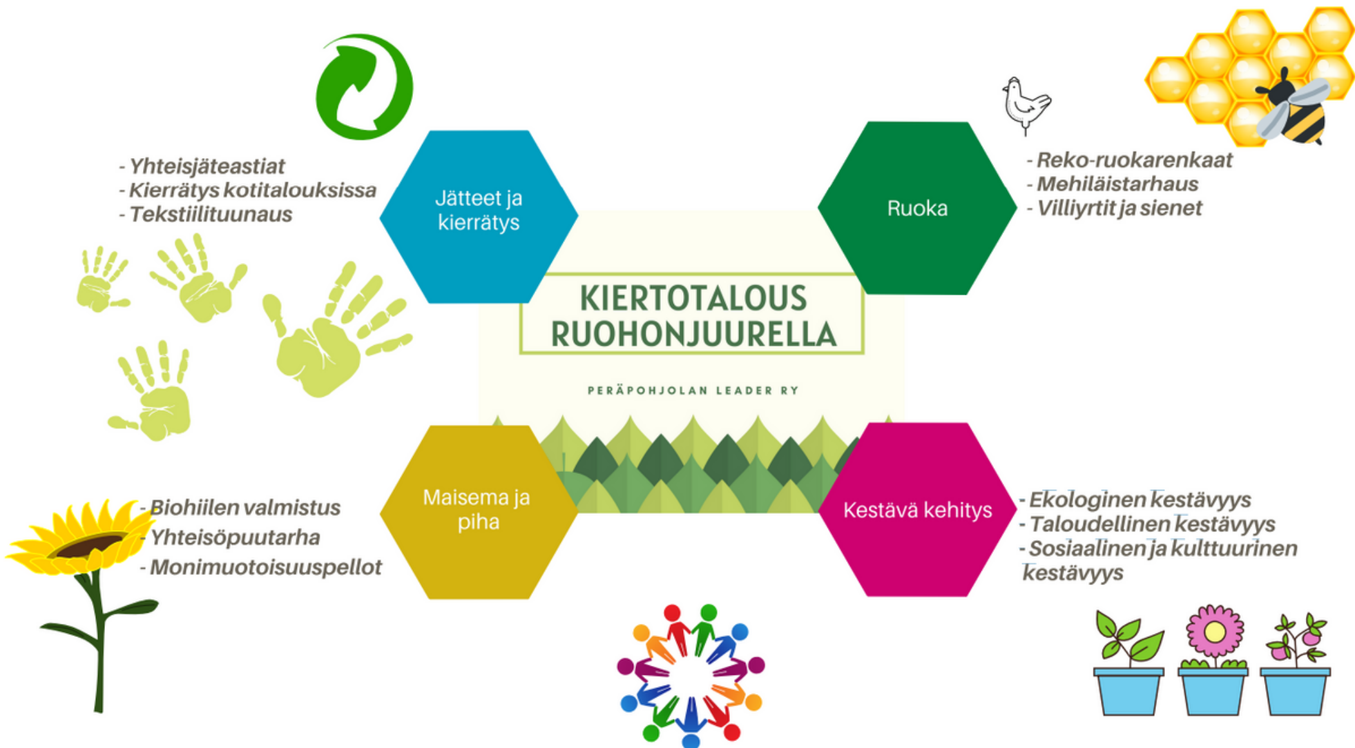
Hankkeen työpaketit (Hankesuunnitelma 2021)