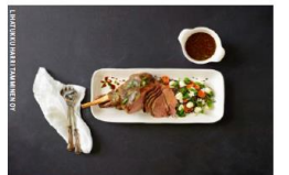
Pääsisäpöydästä maistuu kotimainen karitsanpöytä, joka on parhaim-millaan maadotti maustettuna esimerkiksi timjamilla tai mintulla.

Työväijäpö sykyyllä Monella lammasosiossa emoi karte-soiva kevyällä. Parikan tila on stu-täily-pöytätyöväijäpösykyä, mikä tuottaa karitsanlihan saavutusta ympäri vuoden. Karitsanlihan saavut-