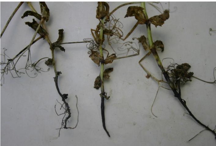
Kuva 3. Herneenlakeastetauti on vakava hernettä vikuuttava kasvitauti, jonka torjunnassa riittävän pitkä viljelykierto on toistaiseksi ainoa tehoava torjuntatoinenpide.