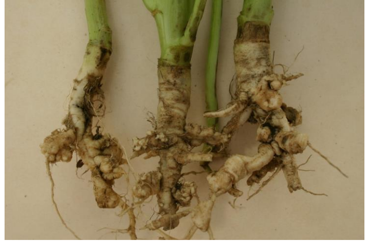
Kuva 2. Eri peittäusvalmisteiden tehokkuuden testausta

Tunne taudinaiheuttajan elinkierto. Suurin osa taudinaiheuttajista säilyy elinkykyisenä maassa tai kasvijätteessä 1–3 vuotta, mutta osa voi säilyä pidempäänkin. Erityisesti ristikukkaisiin ja hernekasveihin kuuluvilla lajeilla on taudinaiheuttajia, jotka voivat säilyä maassa useita vuosia. Maan muokkauksella, kasvijätteiden määrällä, maatumisen asteella sekä talven sääoloilla on vaikutusta erityisesti kasvijätteessä talvehtivien taudinaiheuttajien elinvoimaan (erityisesti lehtilaikkutautien aiheuttajat, osa tyvi- ja juuristotaudeista).