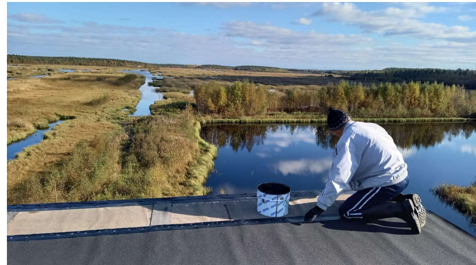
Kuva. Ensimmäisen tornin katon laitto ja näkymä kosteikolle.