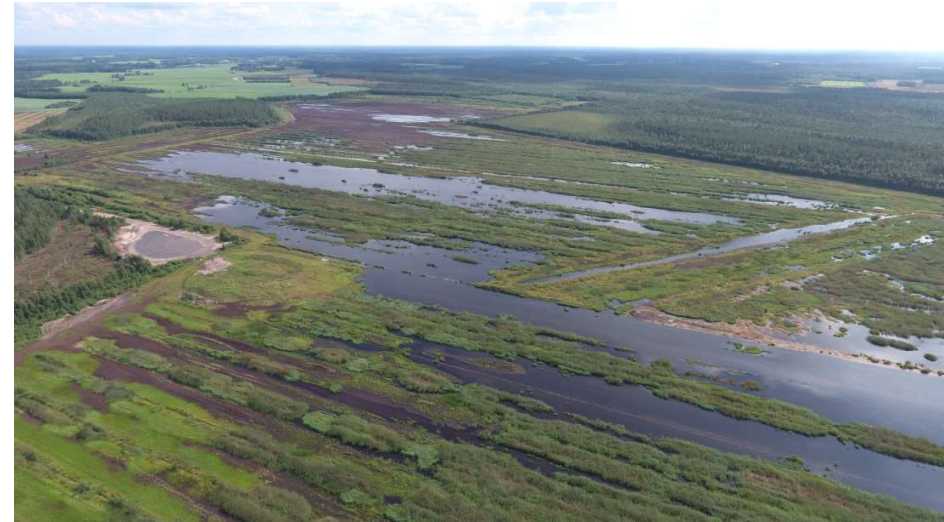
Kuva. Hangasnevan kosteikkoa 4.8.2017. Kuvassa vasemmalla näkyy puupolttoaineiden varastointialue.