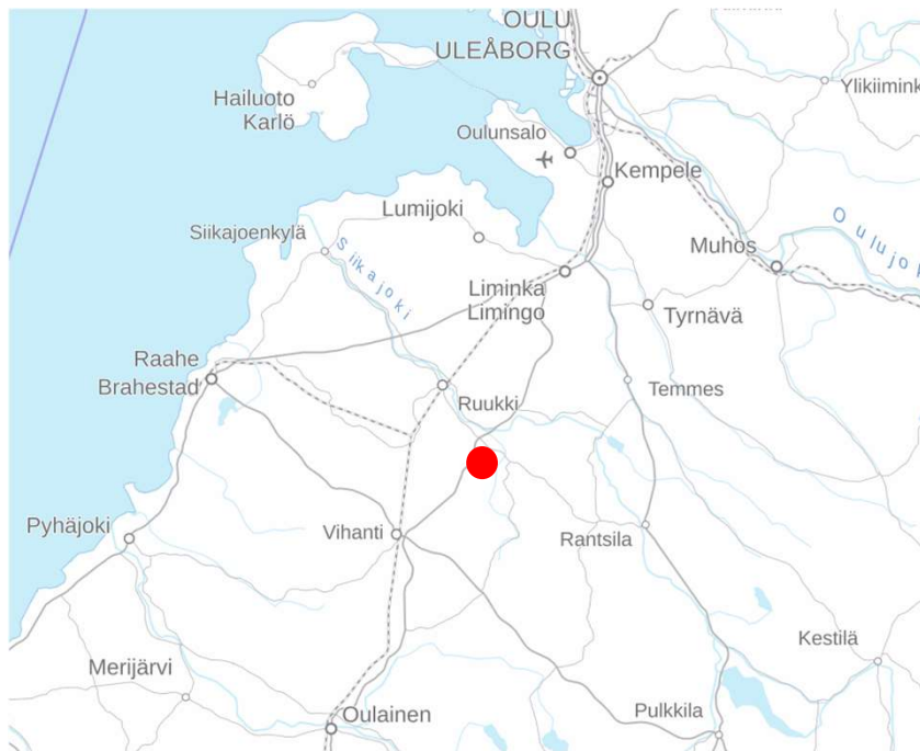
Kuva. Lähestymiskartta. Maanmittauslaitoksen taustakartta 10/2025

Hangasnevan entinen turvetuotantoalue sijaitsee noin 2 km Paavolan taajaman eteläpuolella 86-tien varressa.