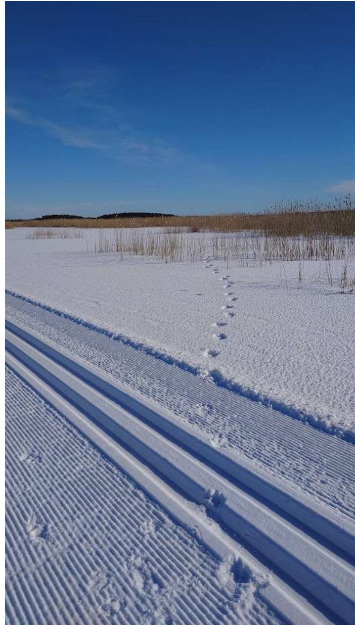
Kuva. Jäljet kosteikolla