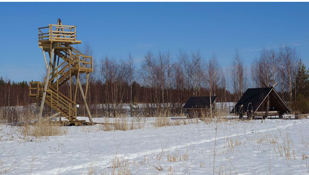
Ala kuvassa. Laavu ja toinen torni.