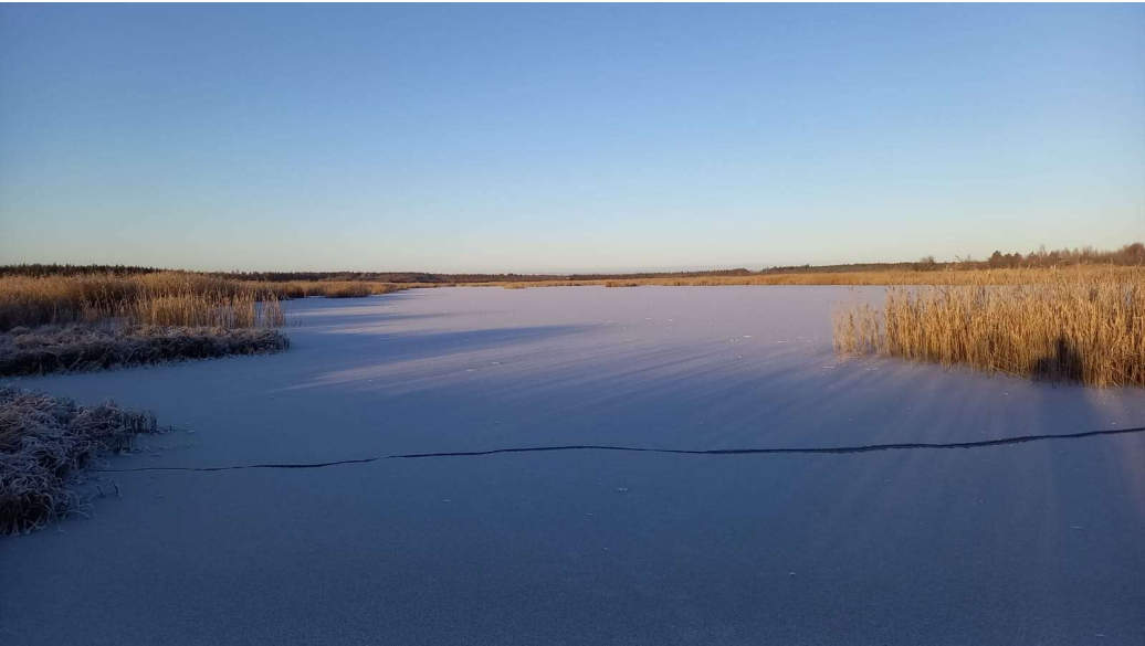
Ylä kuvassa. Kosteikon vesialue jäässä.