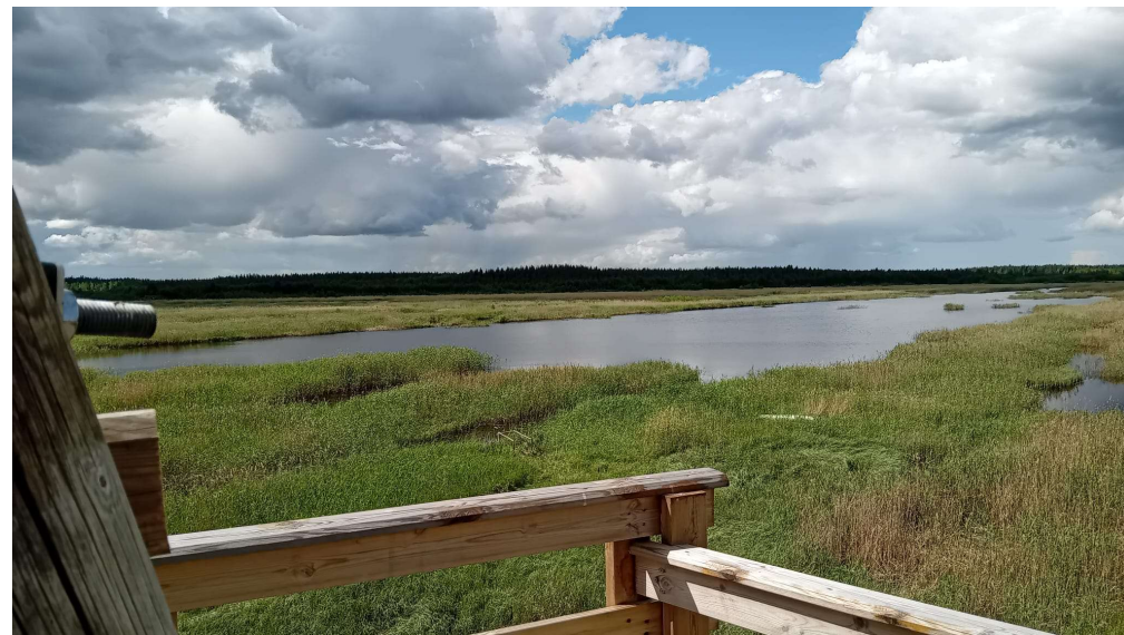
Kuva. Kosteikko kuvatta toisesta tornista.