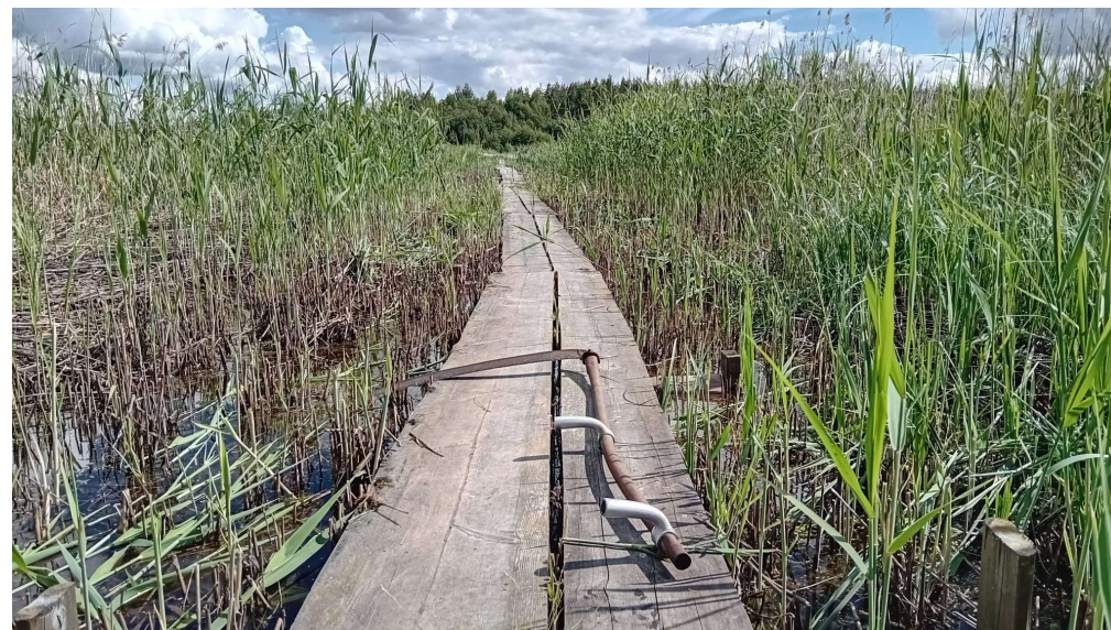
Kuva. Pitkospuut kesällä.