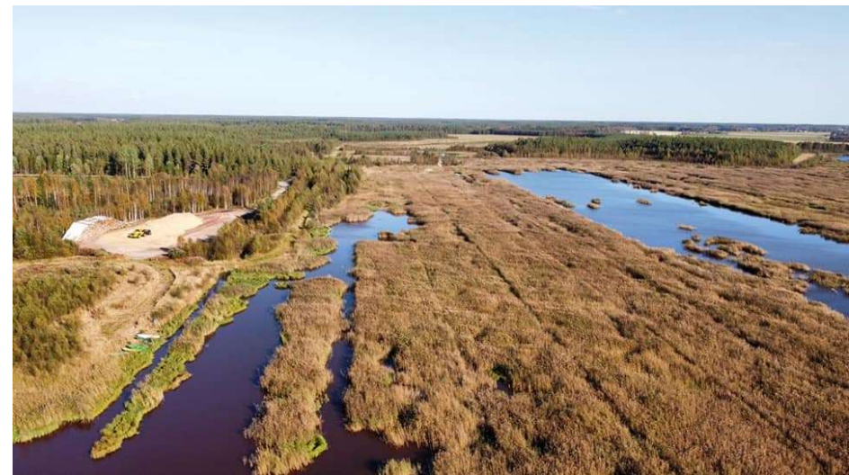
Kuva. Hangasnevan kosteikkoa 22.9.2023. Kuvassa vasemmalla näkyy puupolttoaineiden varastointialue.