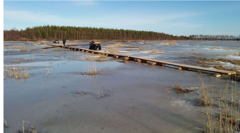
Kuva. Pitkospuiden rakentaminen aloitettiin jäiden päälle talvella 2020.