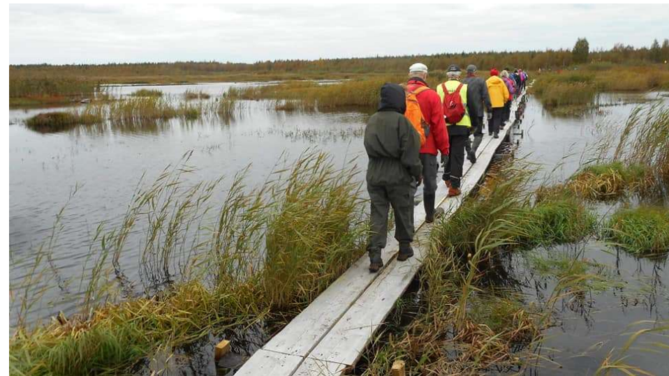
Kuva. Retkeilyryhmä pitkospuilla.