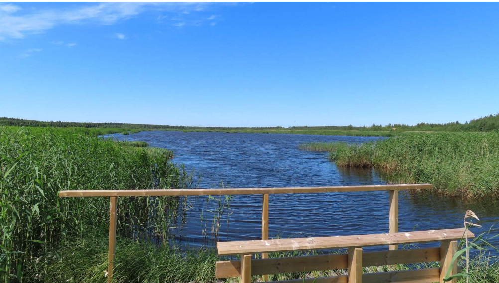
Kuva. Maisemapaikka.