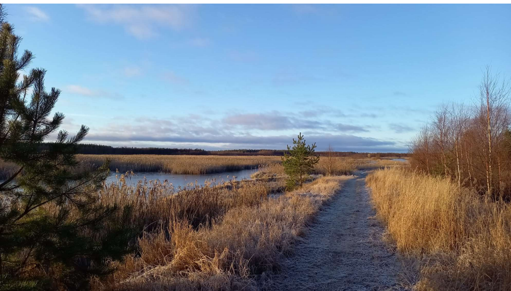
Kuva. Polku syksyllä.