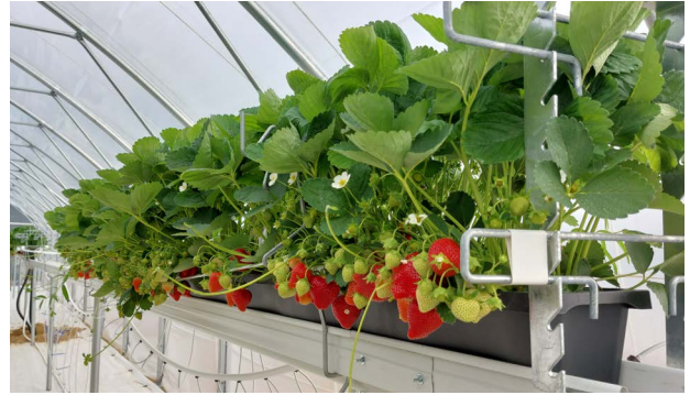
Kuva 3 | Tunneliviljelyssä marjojen poimintatyö on nopeampaa ja ergonomisempaa kuin avomaaviljelyssä.

Työn hyvä organisointi, työolojen kehittäminen ja työhyvinvoinnin tukeminen ovat keskeisiä tekijöitä