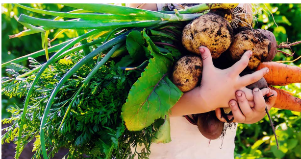
Kuva 4 | Myönteinen asenne kasviksiin ja niiden käyttöön syntyy hyvien kokemusten ja makuelämysten kautta.

Kasvisten kulutuksen kasvu on tavoiteltavaa niin ravitsemuksen kuin ruokajärjestelmän kestävyysnäkökulmista. Kulutuksen edistämiseksi on tärkeää lisätä kasvisten kiinnostavuutta kuluttajien silmissä