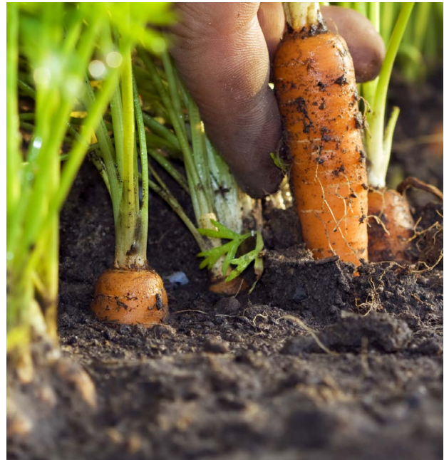
Kuva 2 | Puutarha-alan yrittäjyys vaatii hyvän viljelyosaamisen lisäksi monipuolista talous-, yrittäjyys- ja johtamisosaamista.

Myös parempi vuorovaikutus ketjun sisällä on tarpeen luottamuksen rakentamiseksi ja tuottajien aseman vahvistamiseksi. Tärkeää olisi lisätä eri toimijoiden ymmärrystä tuotannon ja tuotteiden erityispiirteistä, jotta esimerkiksi tuottajilta edellytetyt laatu- ja vastuullisuusvaatimukset eivät ole ylivoimaisia ja siten vaaranna tuotannon kannattavuutta. Viljelijöiltä saadun palautteen mukaisesti myös viranomaisvalvonnan luonnetta tulisi muuttaa neuvonnalliseen suuntaan.